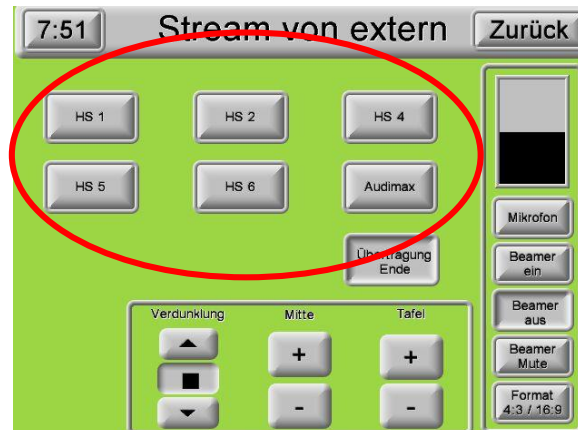
2. Auswahl Hörsaal