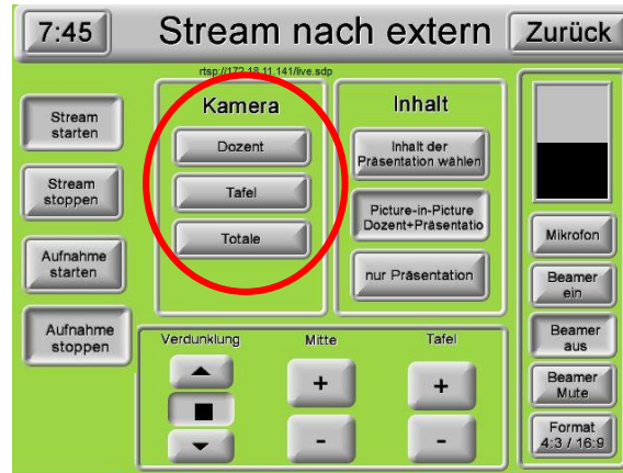
5. Kameraposition auswählen

6. Kontrollieren Sie auf dem Vorschaumonitor, ob die gewünschten Bilder ausgestrahlt werden. ACHTUNG: Das Bild auf dem Vorschaumonitor ist um etwa zwei Sekunden verzögert! Haben Sie bitte beim Einstellen etwas Geduld!