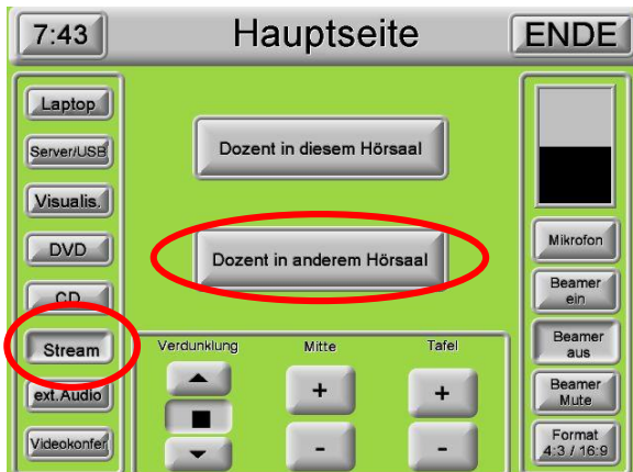
1. Wählen Sie bitte „Stream“ und danach „Dozent in anderem Hörsaal“ aus