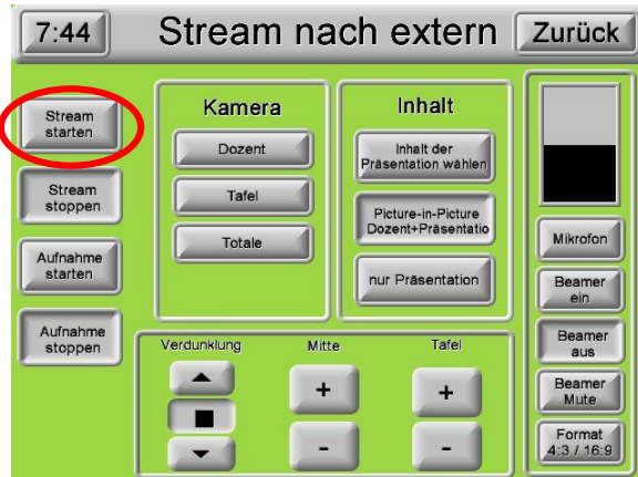
4. „Stream starten“!

Hörsaal 1 – 6 und Audimax (ausführliche Anleitung auf der Website ZIM)